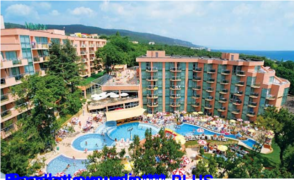
Banchet excursie PLUS